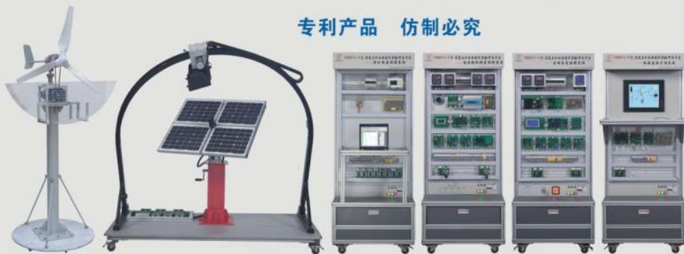
专利产品 仿制必究

承办单位：清华大学、浙江大学、哈尔滨工业大学等 比赛时间：拟定于2017年11月 网站： http://skills.tianhuang.cn