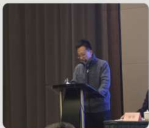
获奖选手代表发言