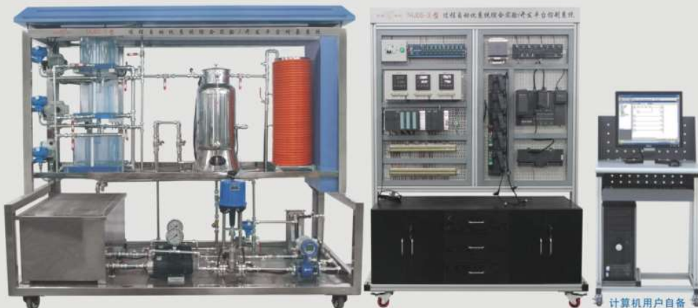
专利产品 仿制必究

承办单位：清华大学、浙江大学、哈尔滨工业大学等 比赛时间：拟定于2017年11月 网站： http://skills.tianhuang.cn