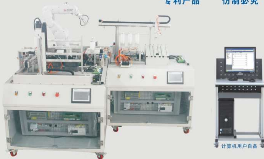
THIMZX-2型 智能制造生产线信息集成与控制实践平台