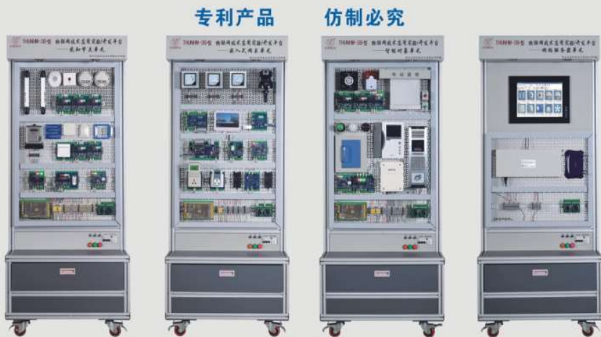
THUNHM-3B型 物联网技术应用实验/开发平台

承办单位：清华大学、浙江大学、哈尔滨工业大学等 比赛时间：拟定于2017年11月 网站： http://skills.tianhuang.cn