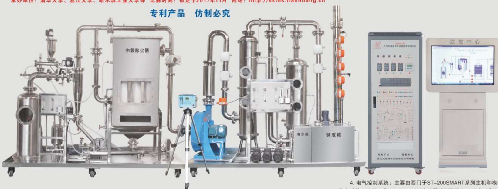
THEMDQ-3型 大气环境监测与治理技术实践平台