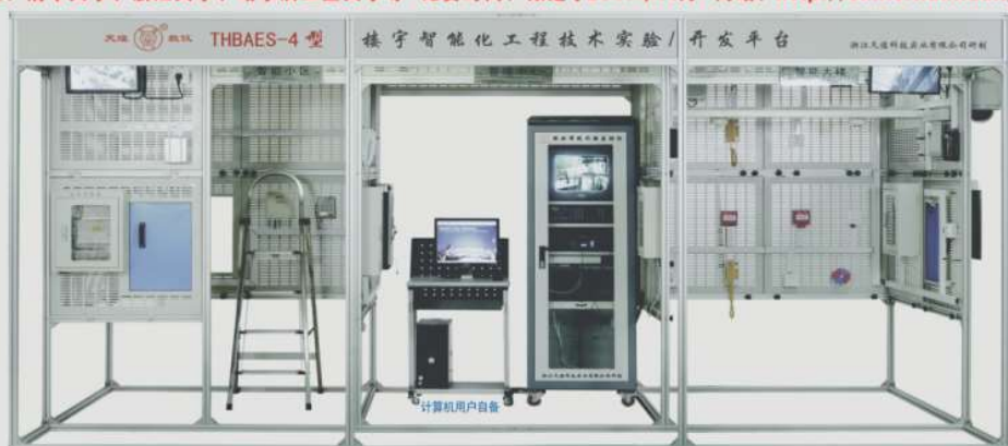
THBAES-4型 楼宇智能化工程技术实验/开发平台