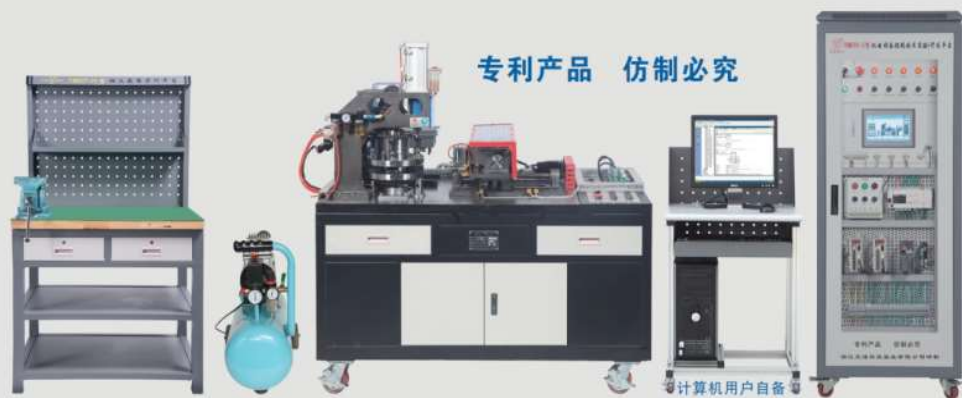
专利产品 仿制必究

承办单位：清华大学、浙江大学、哈尔滨工业大学等 比赛时间：拟定于2017年11月 网站： http://skills.tianhuang.cn